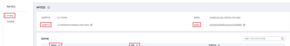
图 7-1 查看项目 ID